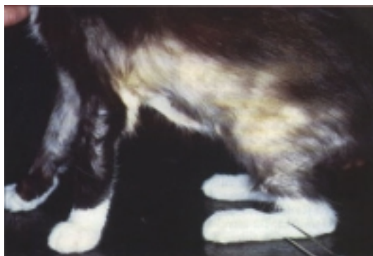
Figur 3a, 3b Klådan kan bli ta sig i uttryck i form av alopeci, då katten har slickat bort pälsen. Detta ses framför allt på buk och ben.