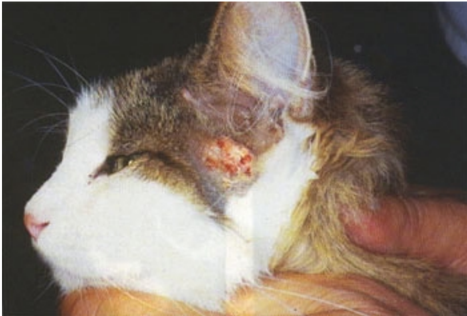
Figur 5 Överkänslighet för foder ger intensiv klåda som ofta kommer plötsligt, fastän katten kanske ätit den utlösande foderkomponenten i flera år.

Fodermedelsöverkänslighet kan drabba katter i alla åldrar. I en undersökning av Carlotti och medarbetare var katterna mellan sex månader och tio och ett halvt år (8). I en annan undersökning av White och Sequoia varierade åldern från ett till elva år (34) och i en tredje undersökning av Rosser varierade åldern från tre månader till elva år (23). Många katter har ätit det utlösande/allergiframkallande fodret under flera år innan symtom uppträder (8, 17, 33). Eftersom symtomen kommer plötsligt luras man att misstänka någonting som katten har ätit nyligen (33) (Figur 5).