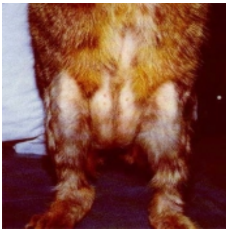
Figur 6 Typiska symtom hos en fyra år gammal europeisk korthårskatt, som slickat av pälsen på buk och bakben på grund av överkänslighet för mjölkprodukter.

Sista steget är att försöka fastställa vilken proteinkälla som ger besvären. Detta görs genom att till testdieten tillföra ett nytt fodermedel var tionde dag (33). Det nya fodermedlet, t ex mjölk, ges tillsammans med testdieten under tio dagar (Figur 6).