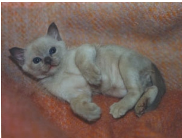
Figur 1. Foderkänslighet kan drabba alla raser, alla åldrar och såväl hon- som hankatter

Katter av alla raser, alla åldrar och hon- såväl som hankatter kan visa sig vara känsliga för vissa fodermedel eller substanser som bildats i eller tillförts fodret (Figur 1).